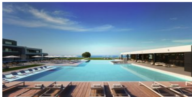
Der Poolbereich (Modellskizze)

JUNIORSUITEN / MAISONETTE (UA) Ca. 30-35 qm. Für 2-3 Personen. Grundausrüstung wie die Superiorzimmer. Wohnbereich mit Schlafcouch für die 3. Person. Eine Treppe führt zu dem offenen