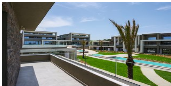
Wohnbeispiel Grand Superiorzimmer