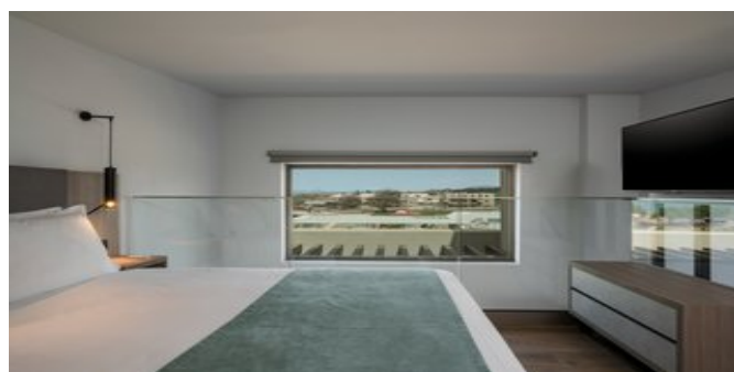
Wohnbeispiel Executive Suites priv. Pool