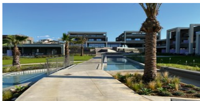
Das Myrion Beach Resort