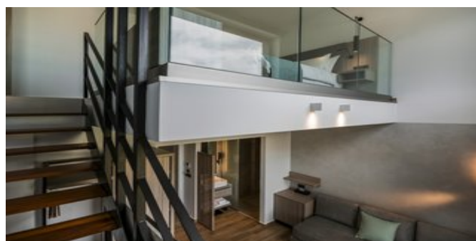
Wohnbeispiel Suiten priv. Pool