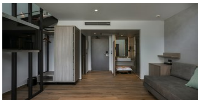
Wohnbeispiel Juniorsuiten /Maisonette