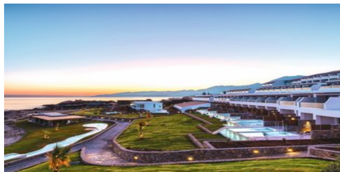
Blick auf die Anlage

LUXURY ZIMMER MIT PRIVATEM OUTDOOR JACUZZI (RC) Ca. 32 qm. Grundausrüstung wie