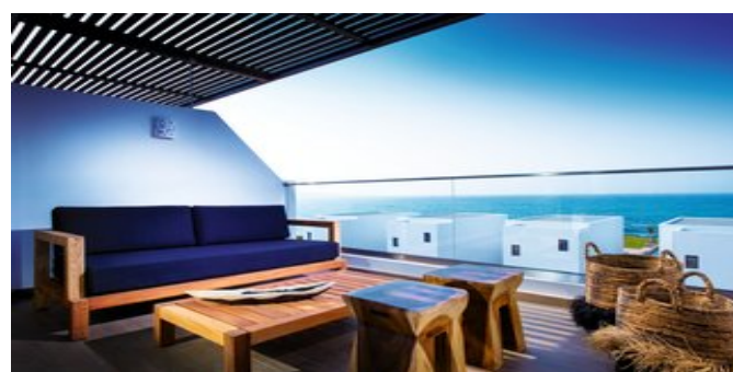
Auf dem Balkon