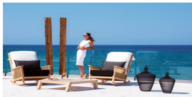
Auf der Terrasse

SPARTIPP Bei Buchung eines Attika Mietwagens Transfergutschrift ab/bis Flughafen EUR 28 pro Person. Einen Mietwagen der Kat. A1 erhalten Sie schon ab EUR 140 pro Woche.