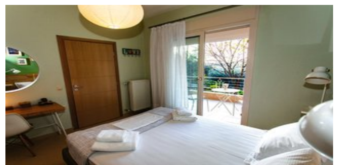
Iona Casa - das Schlafzimmer