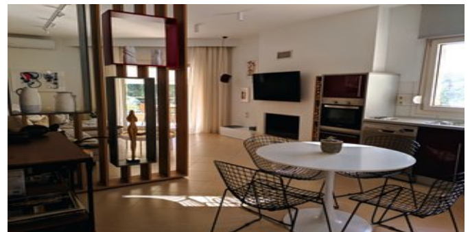
Chroma Suite - der Essbereich