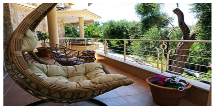
Chroma Suite - Blick vom Balkon