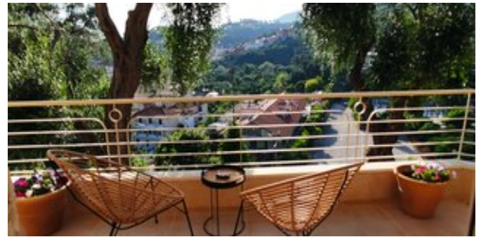
Chroma Suite - Blick vom Balkon

MORPHI SUITE (UB) Ca. 70 qm. Für 2-5 Personen. Grundausstattung wie die Iona Casa. Wohn-/Schlafraum mit Schlafcouch für die 5. Person, komplett ausgestatteter Küche und Essbereich. 2 separate Schlafzimmer mit Doppelbetten. Dusche/WC, Föhn, Pflegeprodukte. Balkon und Terrasse mit Blick zur Stadt.