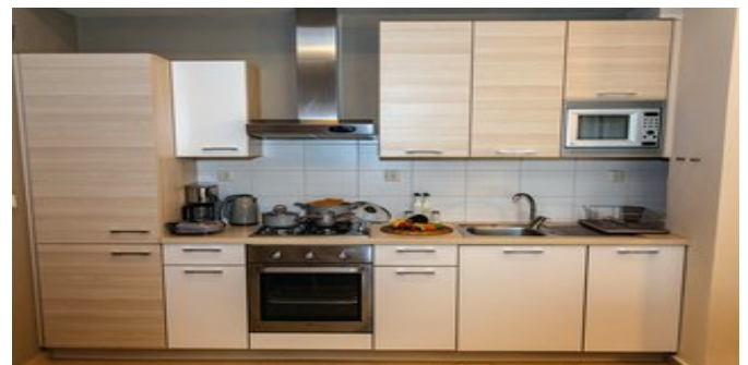
Iona Casa - die Küche