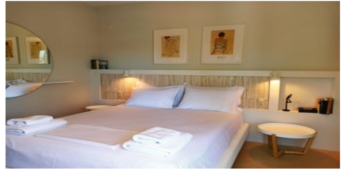
Chroma Suite - eines der Schlafzimmer