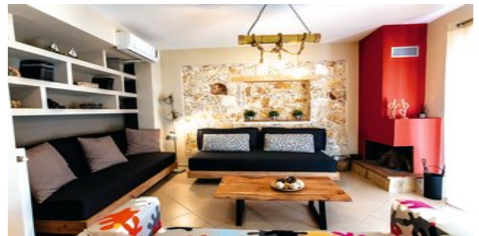
Iona Casa - der Wohn- Schlafbereich