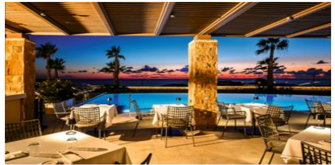
Restaurant auf der Terrasse