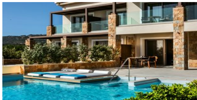
Außenansicht mit Pool

SPARTIPP Bei Buchung eines Attika Mietwagens Transfergutschein ab/bis Flughafen EUR 42 pro Person, ab/bis Hafen bis zu EUR 94 pro Person. Einen Mietwagen der Kat. A1 erhalten Sie schon ab EUR 140 pro Woche.