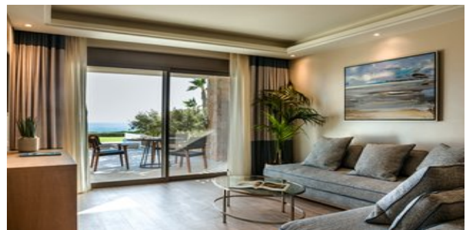
Wohnbeispiel Executive Zimmer mit Sitzecke