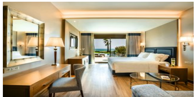
Wohnbeispiel Executive Zimmer