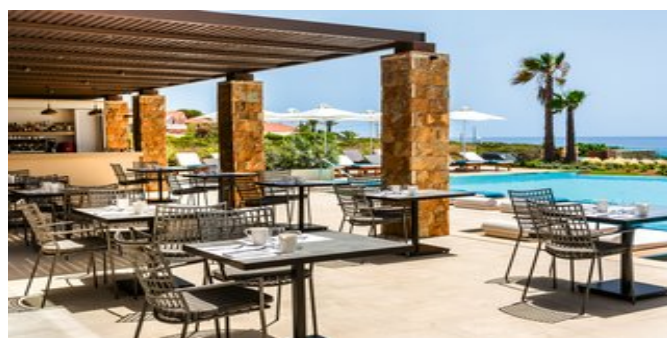
Restaurant auf der Terrasse