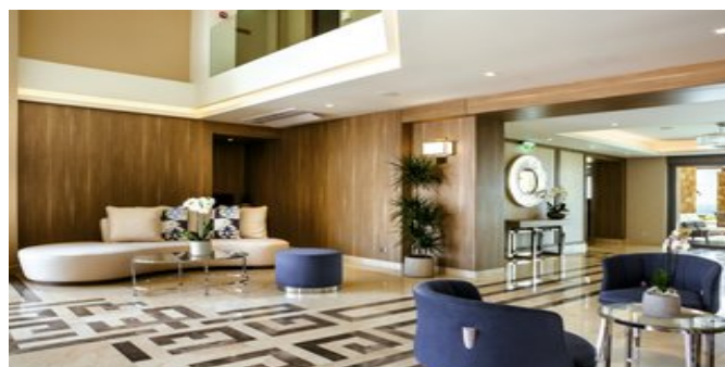
Lobby und Rezeption