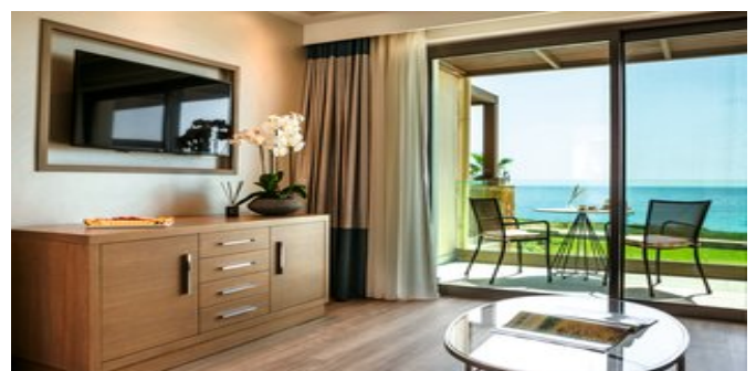
Wohnbeispiel Junior Suite