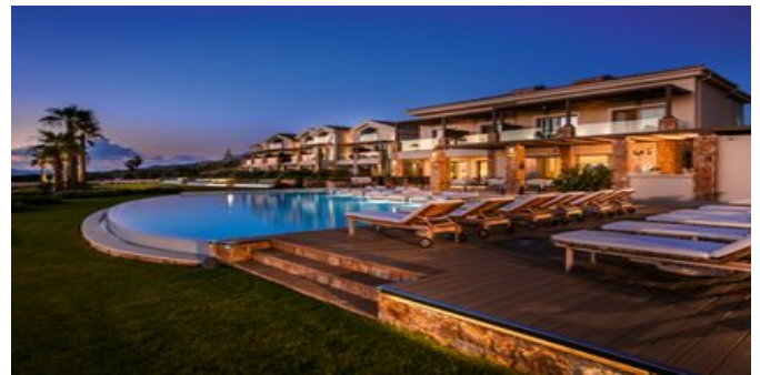
Außenansicht der Ferienanlage