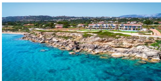
Außenansicht mit Strand