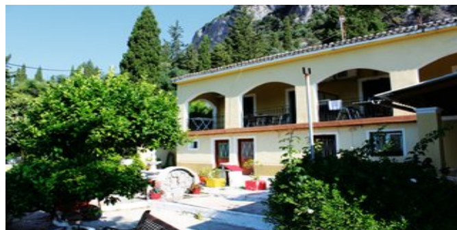
Die Appartements Vassilis