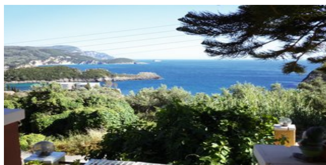
Blick von der Anlage