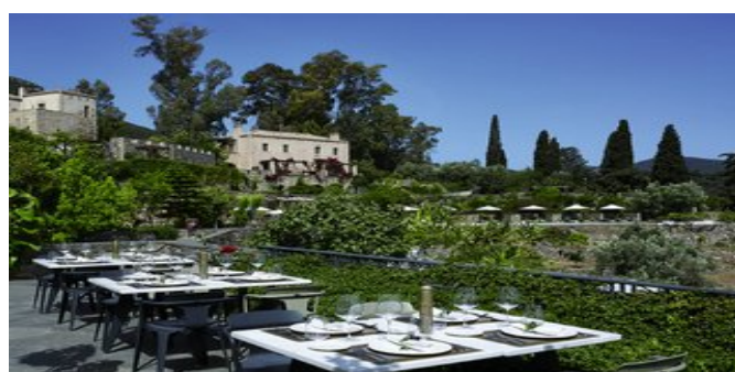
Auf der Restaurantterrasse