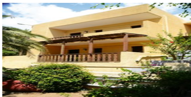
Das Porfyra Village