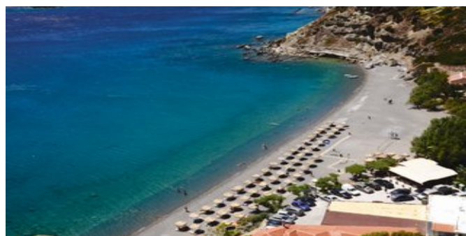
Blick auf den Strand