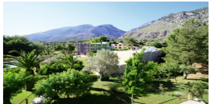
Blick auf das Hotel Idi