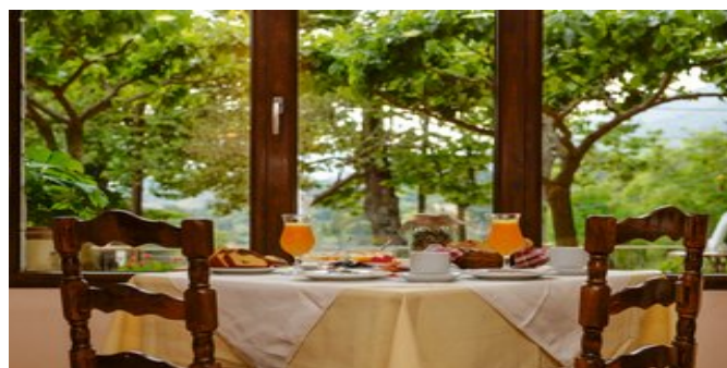
Zeit fürs Frühstück