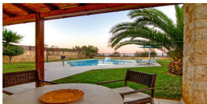
Auf der Terrasse