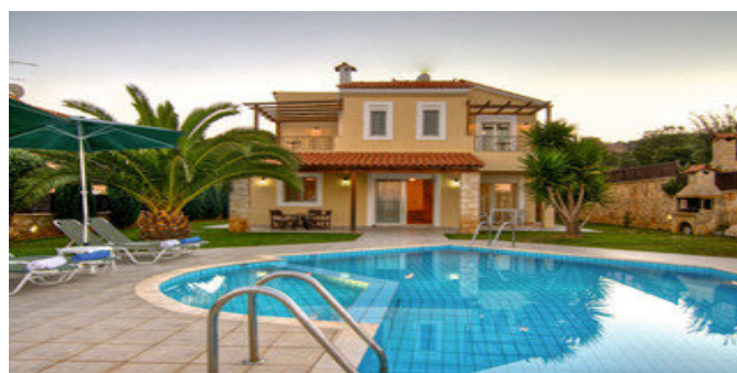
Eine der Villen mit Pool