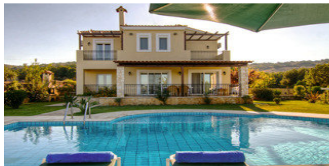
Eine der Villen mit Pool

ATTIKA SERVICE Taxitransfer bei Pauschalreise inklusive.