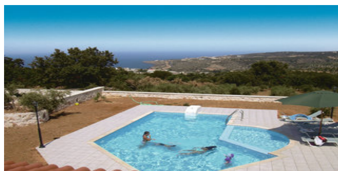
Einer der Pools