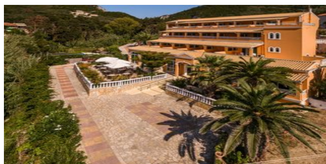
Das Paramonas Hotel