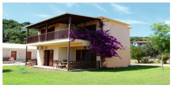
In der Anlage