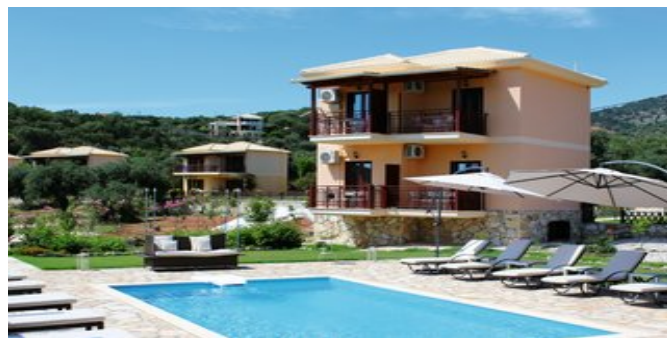
Das Villaggio Sioutis

SPARTIPP Bei Buchung eines Attika Mietwagens Transfergutschrift ab/bis Préveza EUR 156, ab/bis Igoumenítsa EUR 62 pro Person. Einen Mietwagen der Kat. A1 erhalten Sie schon ab EUR 140 pro Woche.