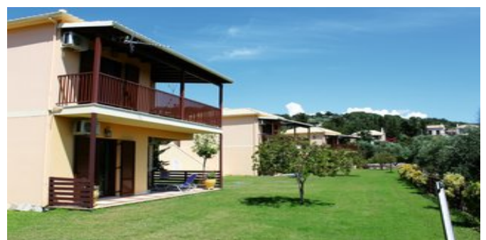
In der Anlage