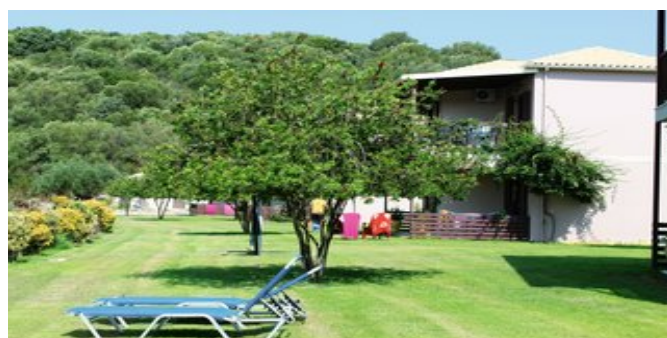
Im Garten der Anlage