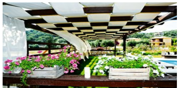
In der Anlage