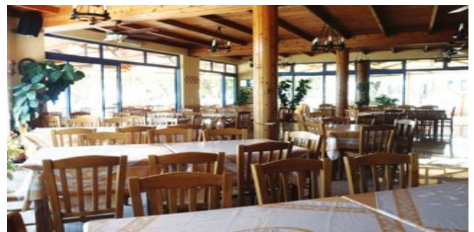
In der Taverne