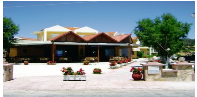
Blick auf die hoteleigene Taverne und das Hotel