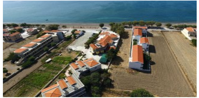
Die Anlage mit Meer

Website: www.attika.de E-Mail: verkauf@attika.de