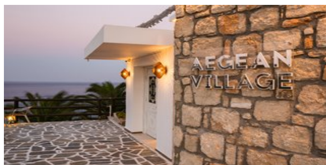
Das Hotel Aegean Village