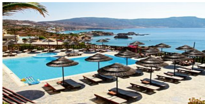
Blick auf den Pool und das Meer

STRAND Vom Hotel führt ein auf ca. 50 m steil abfallender Weg zum Kiesstrand unterhalb des Hotels, teilweise mit Steinen im Wasser (Badeschuhe empfehlenswert). Liegen und Sonnenschirme (gegen Gebühr). 3 weitere kleine