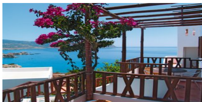
Blick auf das Meer