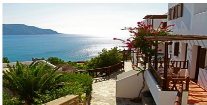
Blick auf die Anlage