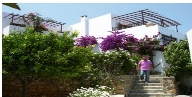
Die Anlage Aegean Village