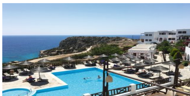
Blick über den Pool und die Anlage