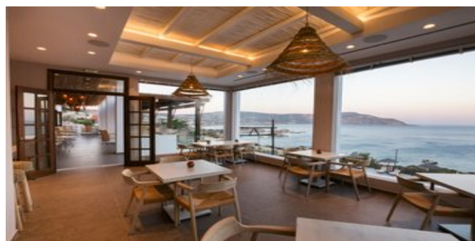
Blick vom Restaurant auf das Meer