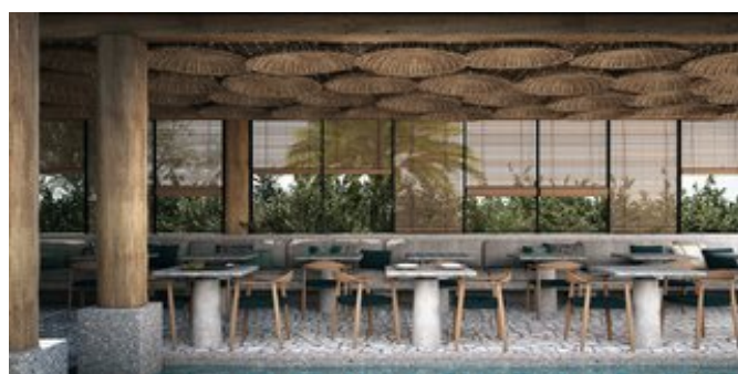
Outdoor Restaurant (Modellskizze)