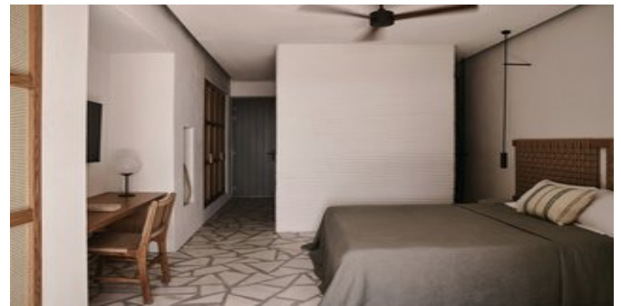
Wohnbeispiel Junior Suiten