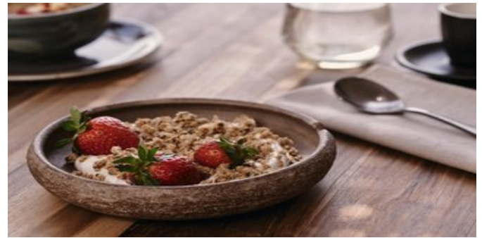
Das Frühstück genießen