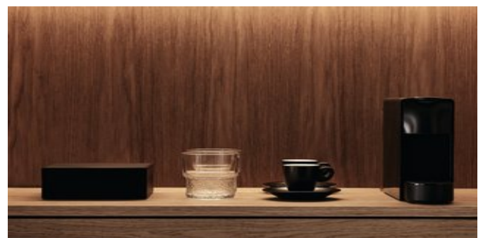
Wohnbeispiel - die Nespresso-Maschine