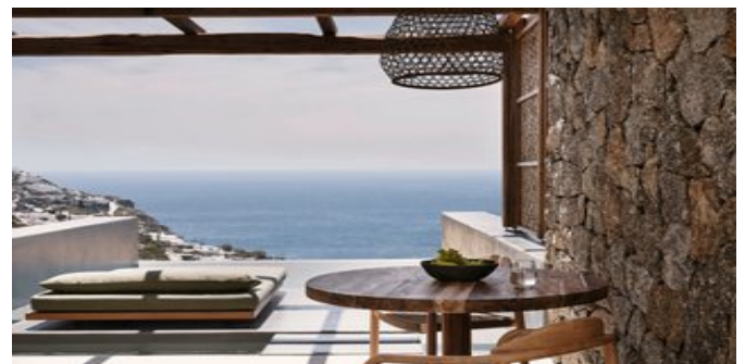
Wohnbeispiel Signature Suiten