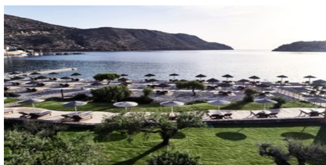
Blick auf den Strand