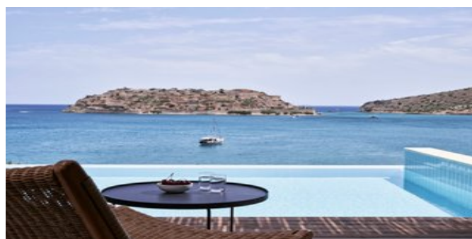
Wohnbeispiel Superior Bungalows mit privatem Pool