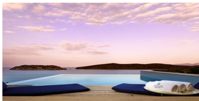
Wohnbeispiel Superior Bungalows mit privatem Pool