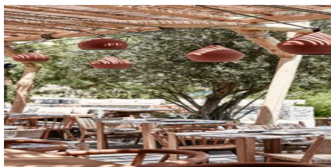
Im "Isola Beach Club"