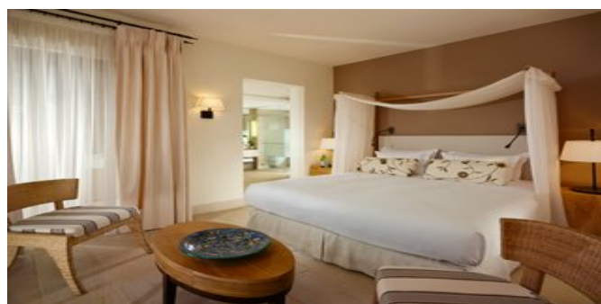
Wohnbeispiel Superior Bungalow