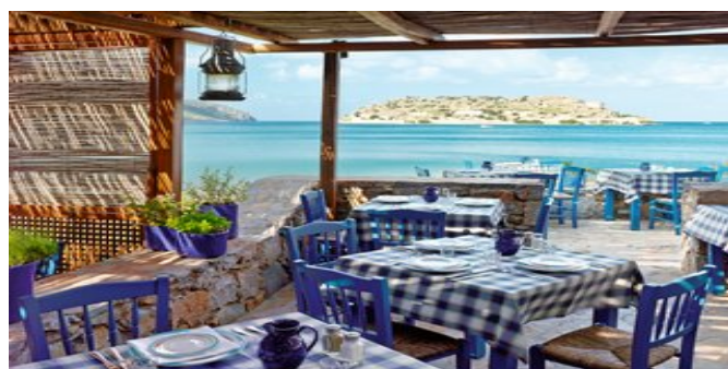
Taverne am Strand