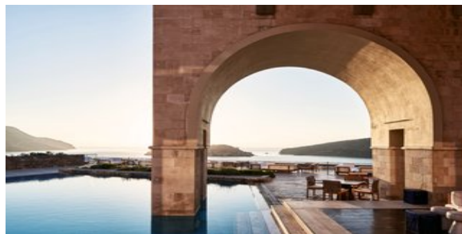
Die Arsenali Lounge

MEDITERRANEAN MAISONETTE-SUITEN MIT PRIVATEM POOL (UA) Ca. 70 qm. Für 2-4 Personen. Großer Schlafraum im 1. Stock und Wohn-/Schlafraum mit ausziehbarer Schlafcouch im Erdgeschoss. Ankleidebereich. Klimaanlage, Telefon, 2 LCD-Satelliten-TVs, W-LAN (High Speed W-LAN gegen Gebühr), Safe, Minibar. Marmorbad mit Jacuzzi-Badewanne, separater Dusche und separatem WC, Bademantel, Slipper. Zweites kleines Bad. Großer Balkon und Terrasse mit Meerblick und Zugang zum privaten Pool mit