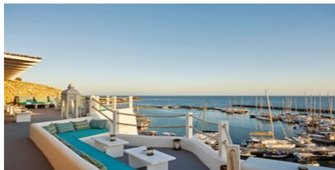
Blick auf den Hafen