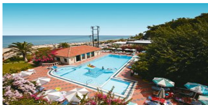
Blick auf den Pool und das Meer