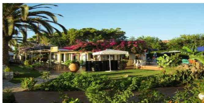
Ein Teil der Anlage