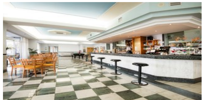
An der Bar