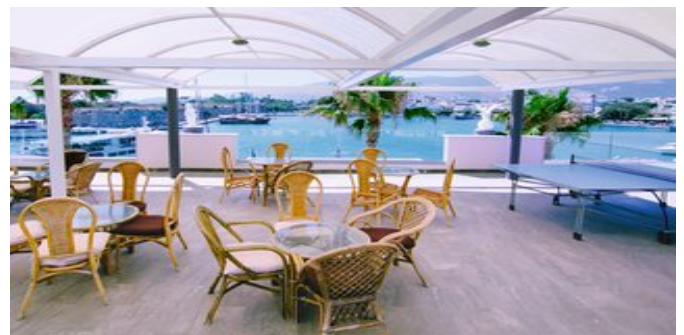
Blick auf das Meer