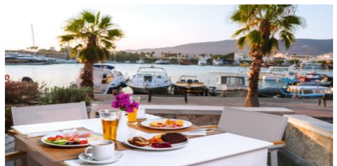
Frühstück im Freien