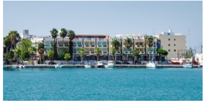
Blick auf das Kosta Palace