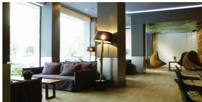
In der Lobby

ATTIKA SERVICE Taxi-Transfer bei Pauschalreise inklusive.