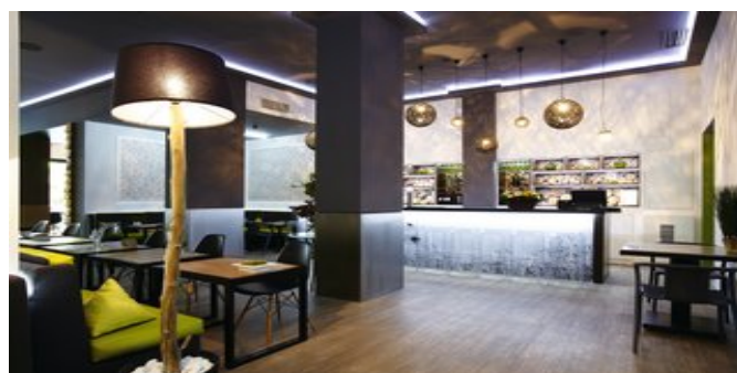
Blick auf die Bar