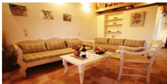
Wohnbeispiel Cottages C