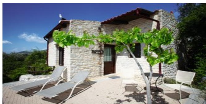
Eines der Cottages