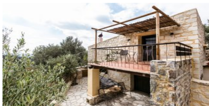
In der Anlage