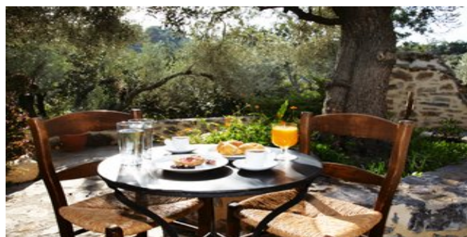
Auf der Terrasse