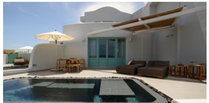
Wohnbeispiel Deluxe Spa Suiten