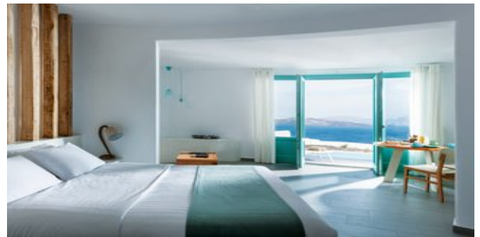
Wohnbeispiel Deluxe Spa Suites