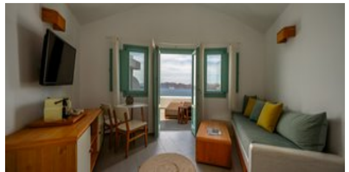
Wohnbeispiel Premium Spa Suites