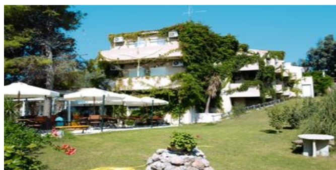
Das Hotel Panas