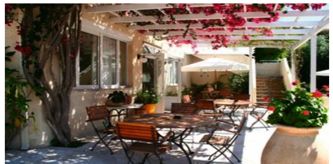
Auf der Terrasse des Hotels Panas