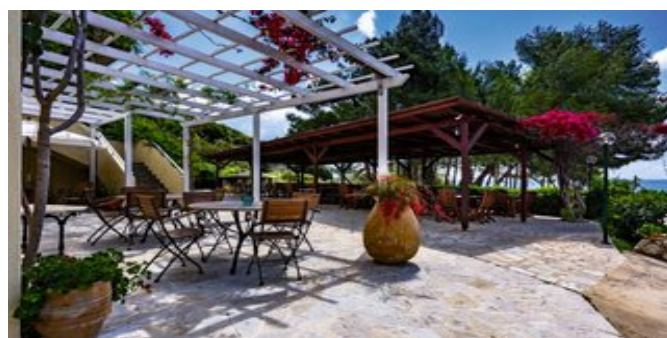
Auf der Terrasse