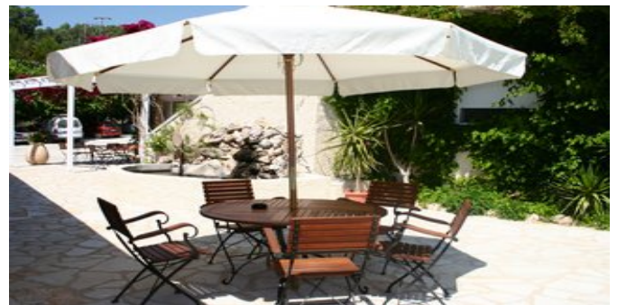
Auf der Terrasse