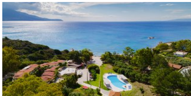
Blick über die Anlage

SPARTIPP Bei Buchung eines Attika Mietwagens Transfergutschrift ab/bis Flughafen EUR 56, ab/bis Hafen bis zu EUR 86 pro Person. Einen Mietwagen der Kat. A1 erhalten Sie schon ab EUR 140 pro Woche.