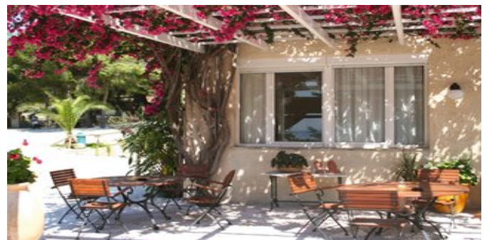
Auf der Terrasse