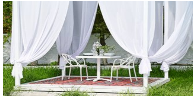
Im Garten des Hotels

HINWEIS Adults Only - das Hotel ist für Gäste ab 16 Jahren buchbar.