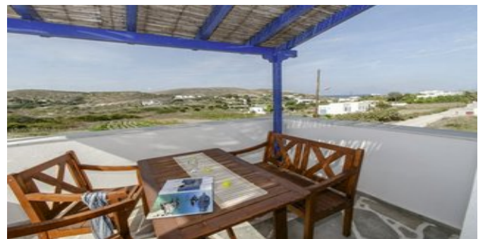
Auf dem Balkon