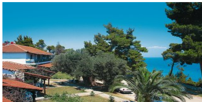
Die Appartements Peristeridis