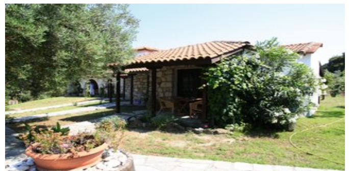
Ein Teil der Anlage