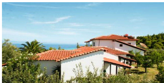
Die Appartements Peristeridis