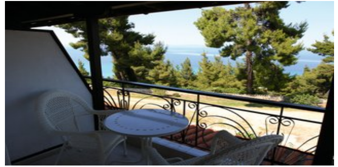
Blick auf das Meer

Website: www.attika.de E-Mail: verkauf@attika.de