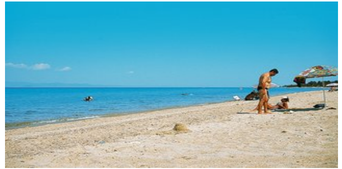
Der Strand bei den Appartements