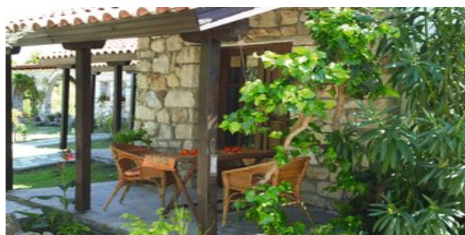
Auf der Terrasse