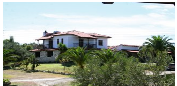
Die Appartements Peristeridis