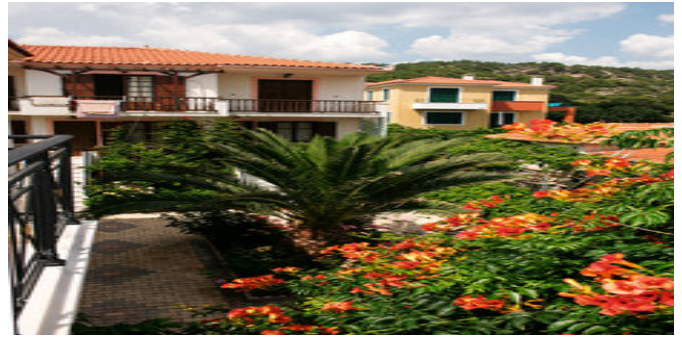
Das Hotel Morfoula