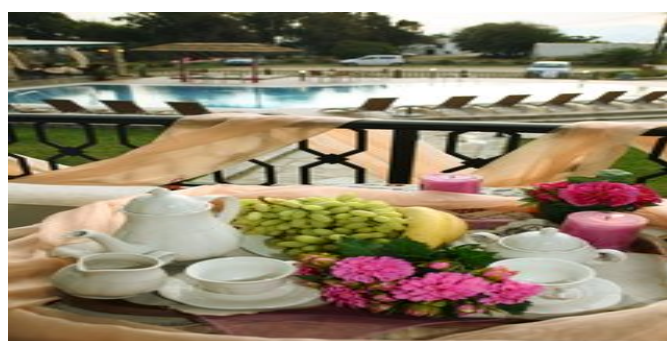
Auf den Balkon