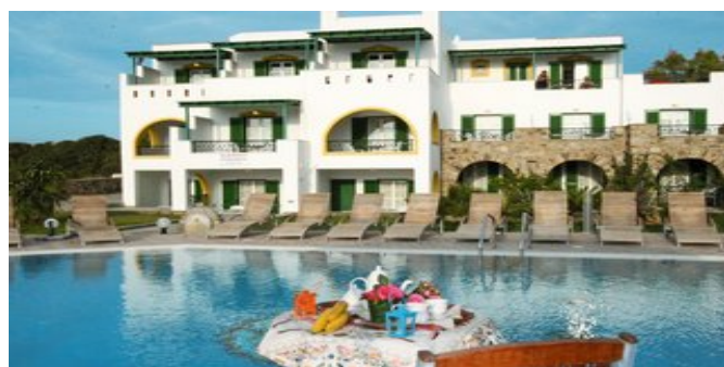
Die Anlage Harmony Villa