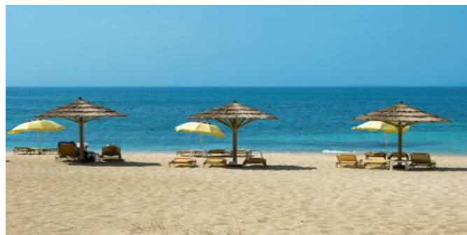
Der Strand bei der Anlage

VERPFLEGUNG Ü, ÜF (kontinentales Frühstück, das an der Poolbar eingenommen wird).