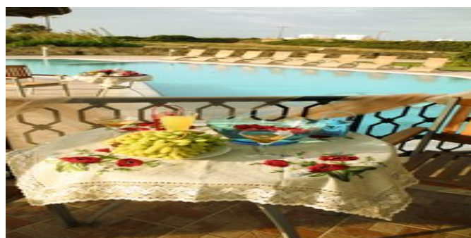
Auf den Balkon