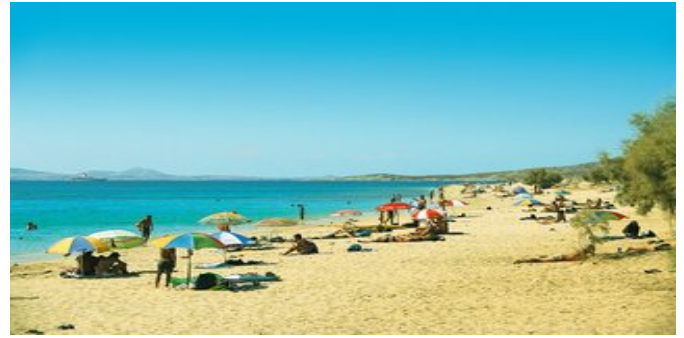
Der Strand von Pláka

SPARTIPP Bei Buchung eines Attika Mietwagens ab/bis Hafen Transfergutschein EUR 54 pro Person. Einen Mietwagen der Kat. A1 erhalten Sie schon ab EUR 140 pro Woche.