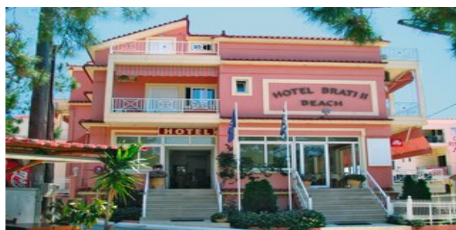
Das Hotel Brati Beach