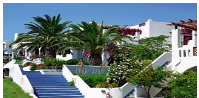
Das Hotel Amoopi Bay