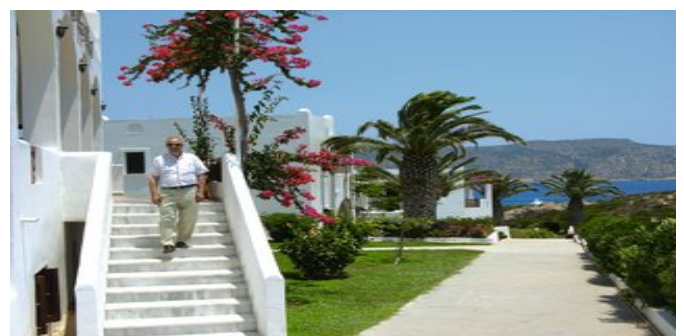
Das Hotel Amooopi Bay