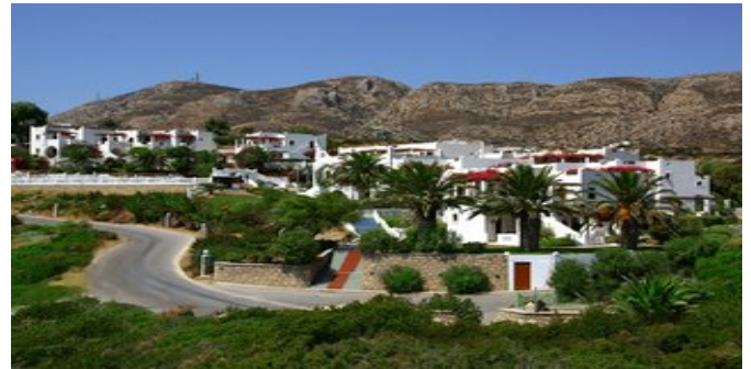
Blick über die Anlage