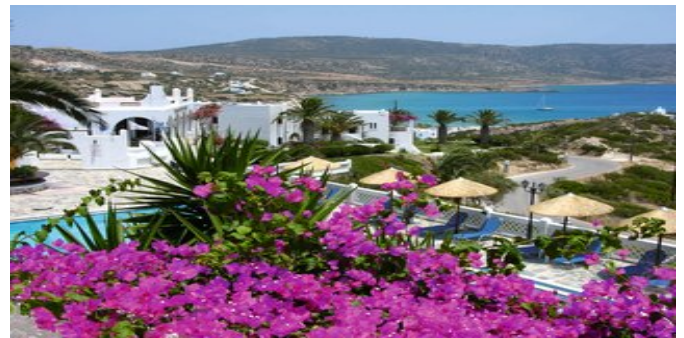
Blick über die Anlage