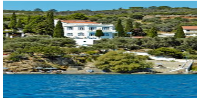
Das Hotel am Meer

AKTIVITÄTEN / SPORT Ohne Gebühr: Tischtennis. Gegen Gebühr: Bogenschießen, Mountainbikes, Yoga. Kochkurse. Am Strand