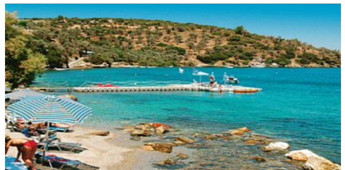
Der Strand beim Hotel