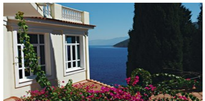
Das Hotel Kerveli Village