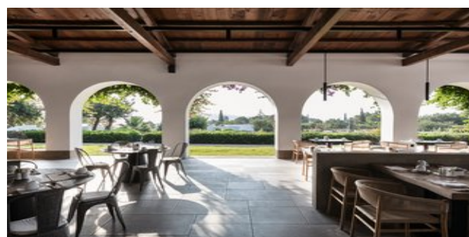
Das Hauptrestaurant - Außenbereich