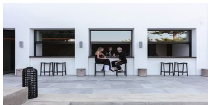
Die Hauptbar - Außenbereich