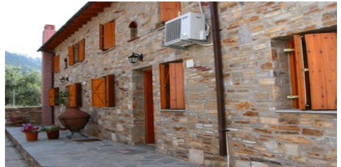
Die Alexis Villas 2