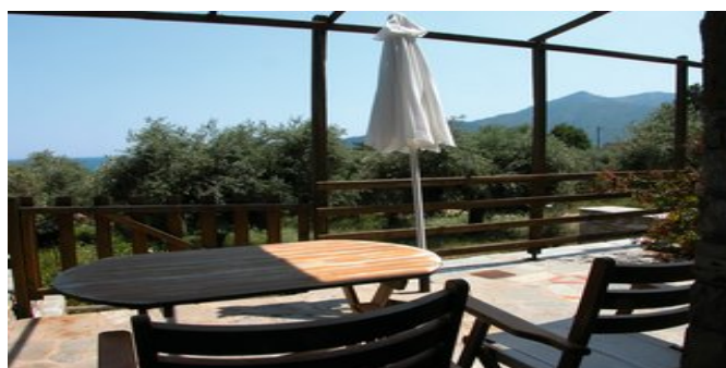
Blick von der Terrasse auf den Olivenhain

LAGE Nur ca. 200 m vom feinsandigen, flach abfallenden Strand von Chrissí Ammoudiá entfernt. Dort befinden sich einige Tavernen, Cafés und Einkaufsmöglichkeiten. Eine Bushaltestelle mit Verbindungen nach Liménas und in den Süden der Insel erreichen Sie nach ca. 150 m.