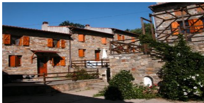
Die Alexis Villas 2