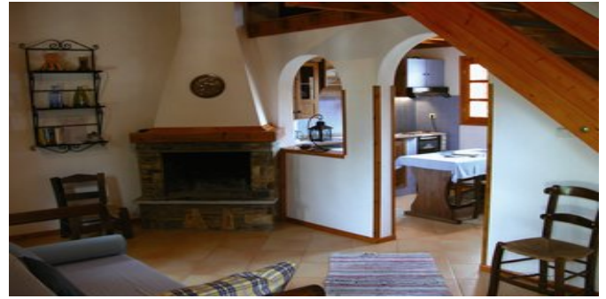
Wohnbeispiel - der Wohn-/Schlafbereich

SPARTIPP Bei Buchung eines Attika Mietwagens ab/bis Flughafen Transfergutschrift EUR 110 pro Person. Einen Mietwagen der Kat. A1 erhalten Sie schon ab EUR 147 pro Woche.