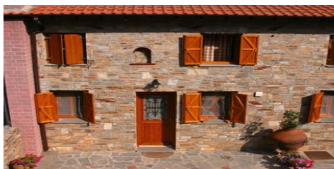
Die Alexis Villas 2