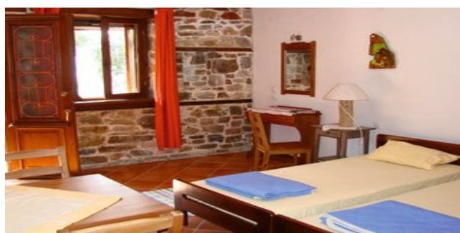
Wohnbeispiel - der offene Schlafbereich