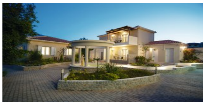
Das Hotel Estia