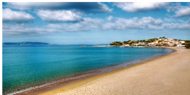
Der Strand von Finikoúnda

STRAND Der Sand-/Kiesstrand von Finikoúnda liegt in ca. 150 m Entfernung. Liegen und Sonnenschirme (teilweise gegen Gebühr). Wassersportmöglichkeiten durch lokale Anbieter. Eine weitere Sandbucht und der Anemómylos-Strand sind zu Fuß erreichbar.