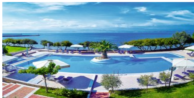
Blick auf den Pool und das Meer

JUNIOR SUITEN GARTENBLICK (UA) Ca. 34 qm. Für 2-3 Erwachsene oder 2 Erwachsene und 2 Kinder. Grundausstattung wie die Standard Zimmer, jedoch geräumiger, zusätzlich mit Sofabett im optisch abgetrennten Wohn-/Schlafraum. Bad/WC, Föhn, Badeartikel,