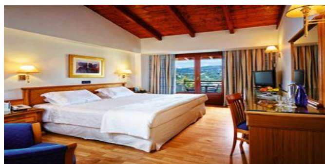
Wohnbeispiel Deluxe Zimmer zur Landseite