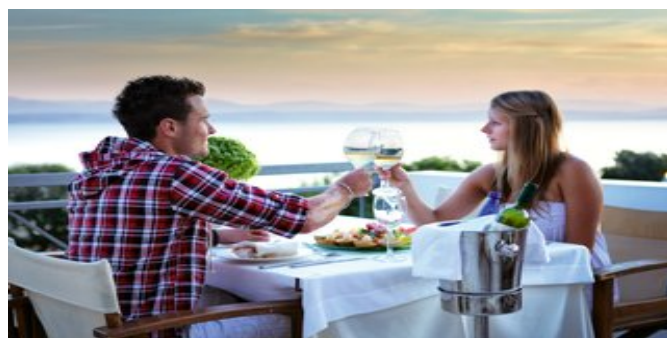
Auf der Veranda