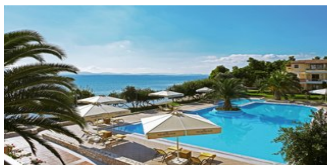
Blick auf den Pool