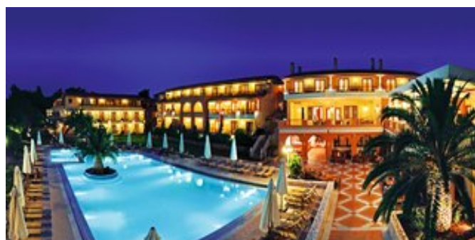
Das Negroponte Resort