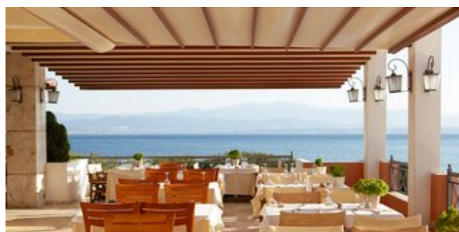
Das Levante Restaurant