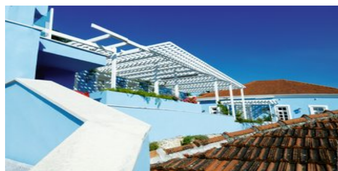
Das Hotel Perantzada