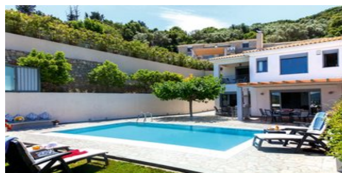
Außenansicht mit Pool