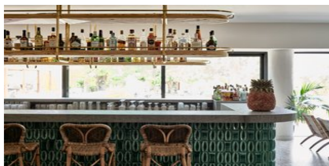
An der Lobbybar