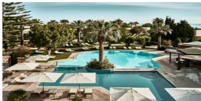
Blick auf den Poolbereich

JUNIORSUITEN (UA/UB) Ca. 34 qm. Für 2-3 Erwachsene und 1 Kind. Grundausrüstung wie die Zimmer, zusätzlich mit Nespresso-Maschine. Komfortabel eingerichteter Wohn-/Schlafraum mit