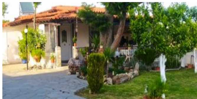
Gartenanlage Ekali Haus

EXTRAS Zur Begrüßung stehen eine Flasche Wein und etwas Süßes für Sie bereit.