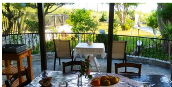
Terrasse mit Blick auf den Garten