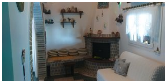
Wohnbeispiel mit Kamin