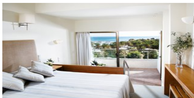
Wohnbeispiel Premium Zimmer