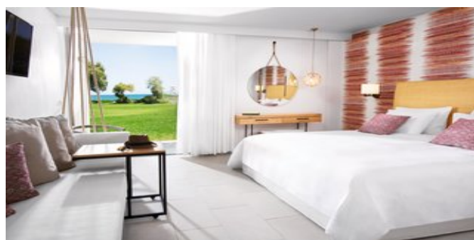
Wohnbeispiel Superior Bungalows