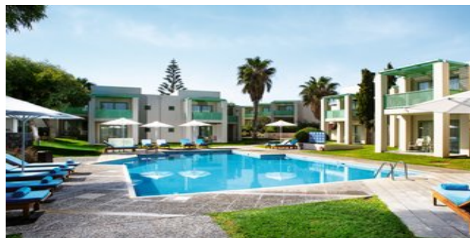
Die Exclusive Bungalows

BUNGALOWS (BA/BG/BH/BI) Ca. 25 qm. 2017 renoviert. Grundausstattung wie die Zimmer, jedoch geräumiger. Klimaanlage (individuell regelbar). Dusche/WC, Bademantel, Slipper, Badeartikel und Strandtücher. Balkon oder