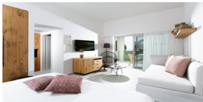
Wohnbeispiel Exclusive Bungalows