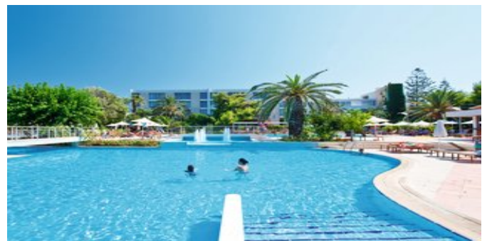
Die Anlage mit Pool