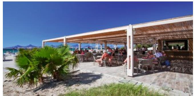
Die Snackbar am Strand