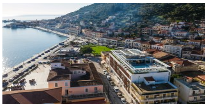
Das Las Hotel & Spa