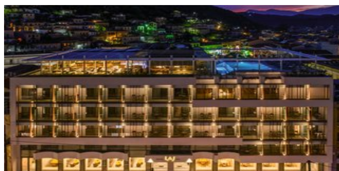
Das Las Hotel & Spa