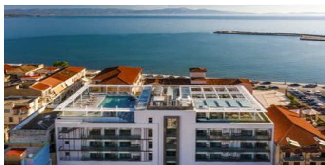
Das Las Hotel & Spa