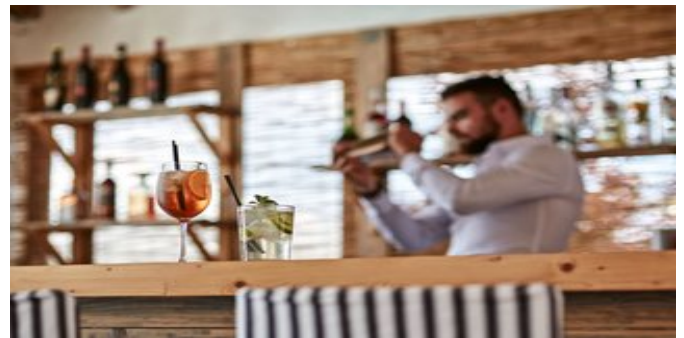
An der Bar