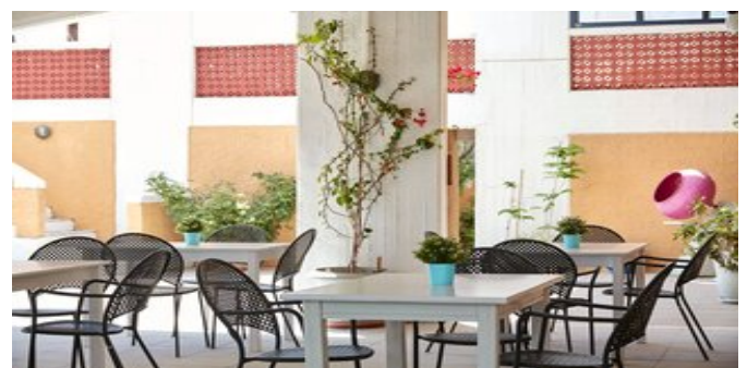
Auf der Terrasse des Mare Vista Hotels