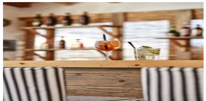
An der Bar