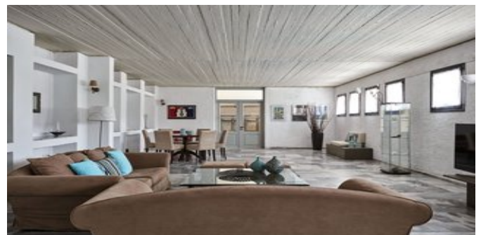
In der Lobby