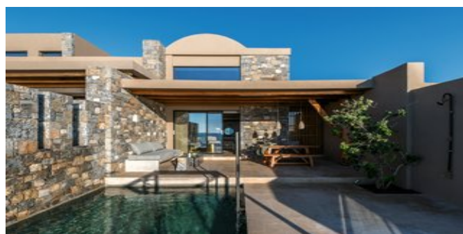
Wohnbeispiel Loft Suiten