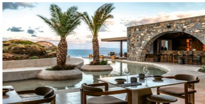
Gartenanlage mit Terrasse

STRAND Den Kieselstrand Mononaftis, mit Liegen