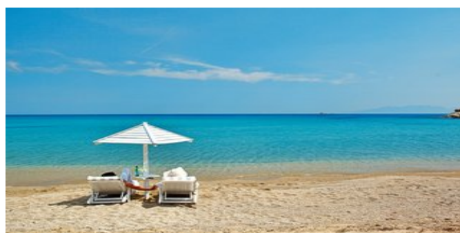
Der Strand beim Hotel