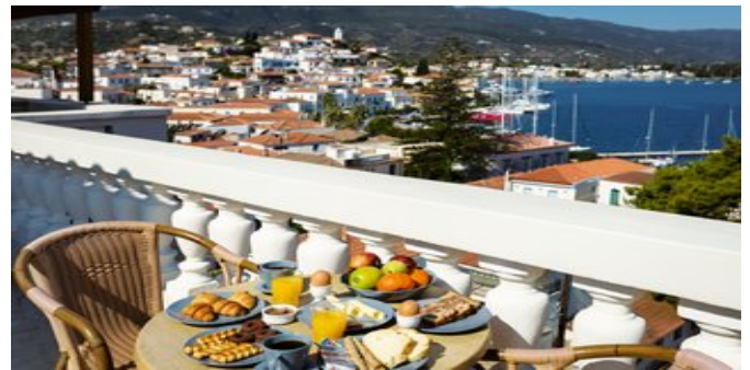
Auf der Dachterrasse