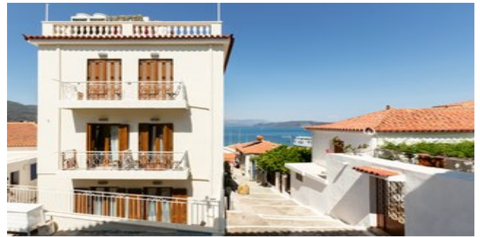
Blick auf das Hotel