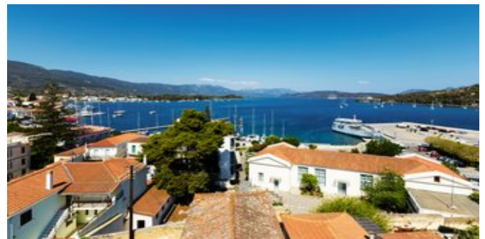
Blick vom Hotel