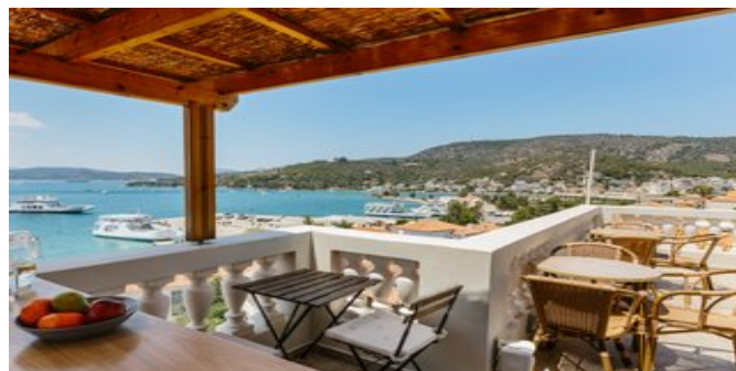
Auf der Dachterrasse