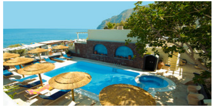
Blick über den Poolbereich

SPARTIPP Bei Buchung eines Attika Mietwagens ab/bis Flughafen Transfergutschrift EUR 38 pro Person. Einen Mietwagen der Kat. A1 erhalten Sie schon ab EUR 154 pro Woche.