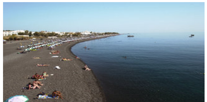
Der Strand von Kamári