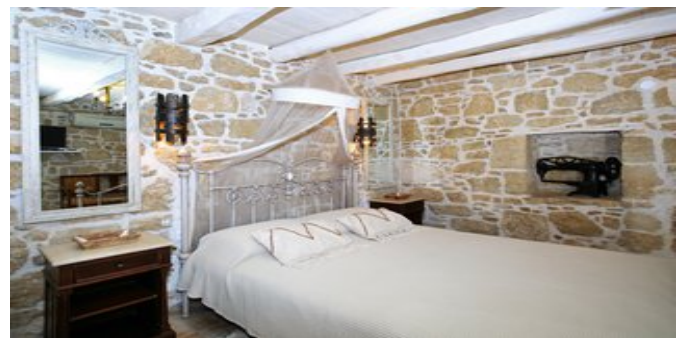
Eines der Schlafzimmer