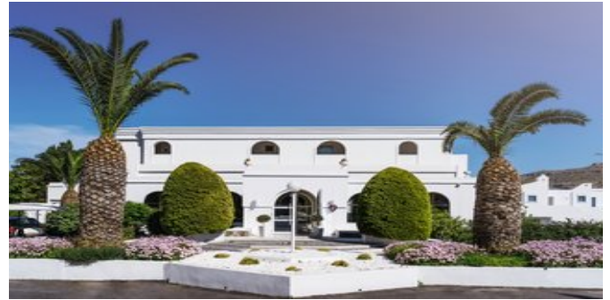
Lindos Village Resort

SPARTIPP Bei Buchung eines Attika Mietwagens ab/bis Flughafen Transfergutschrift EUR 122 pro Person. Einen Mietwagen der Kat. A1 erhalten Sie schon ab EUR 140 pro Woche.