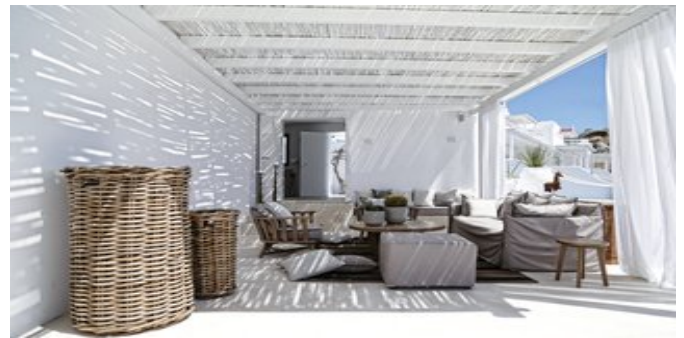
In der Anlage