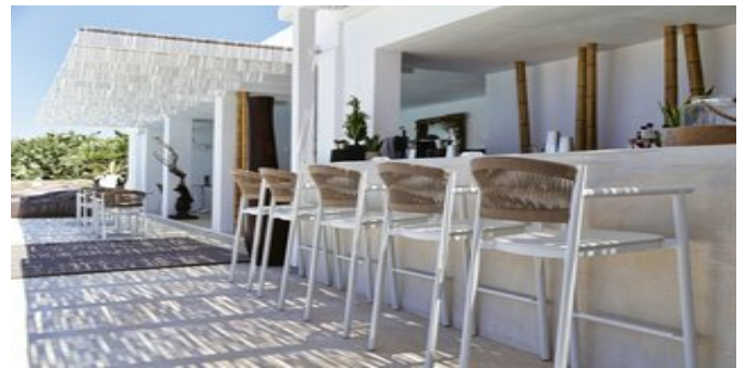
An der Poolbar