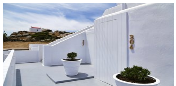
In der Anlage